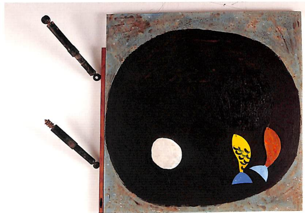
"BROWN AIR, BROWN TREES, BROWN OCEAN AND A DIRTY AUTOMOBILE" 1993 STRETCHER SIZE : 110 x 120 CM. ARCYLIC, FISH HOOKS, CANVAS FISH, SHOCK ABSORBER ON CANVAS