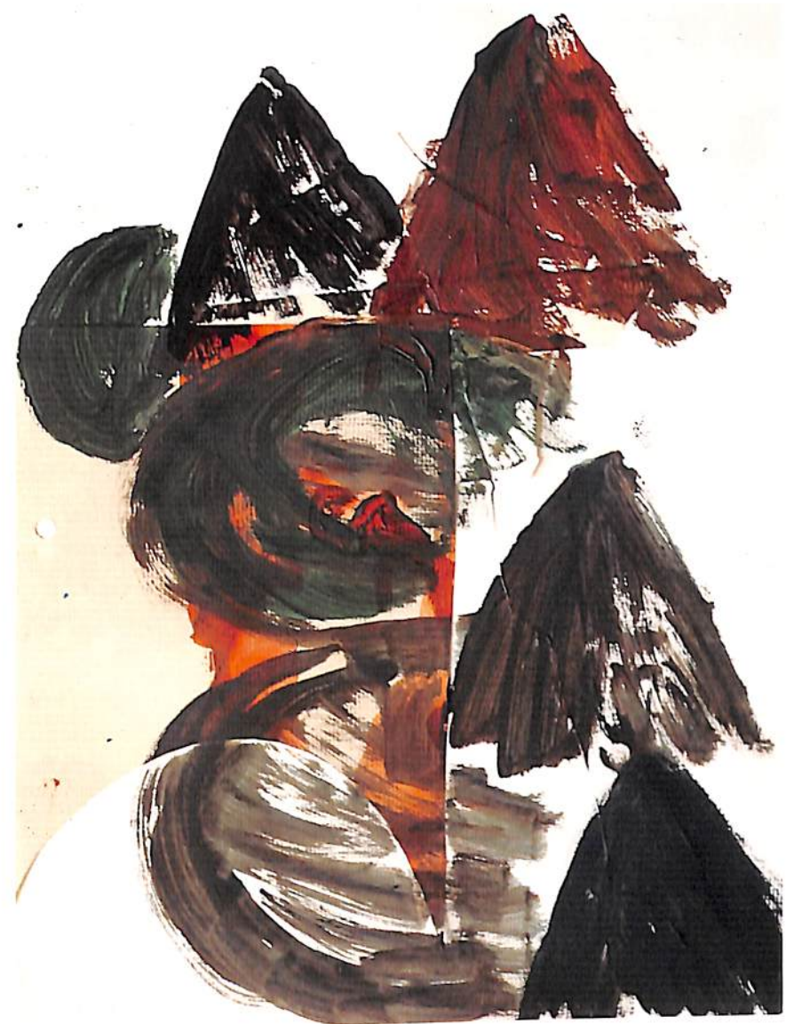
“พิสียา” 1993 25 x 35 CM. ARCYLIC ON PAPER