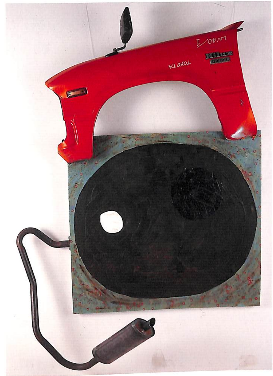
"BROWN AIR, BROWN TREES, BROWN OCEAN AND A DIRTY AUTOMOBILE" 1993