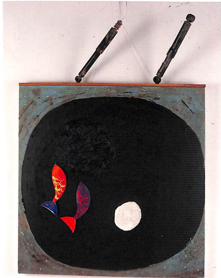
"BROWN AIR, BROWN TREES, BROWN OCEAN AND A DIRTY AUTOMOBILE" 1993 STRETCHER SIZE : 110 x 120 CM. ARCYLIC, FISH HOOKS, CANVAS FISH, SHOCK ABSORBER ON CANVAS