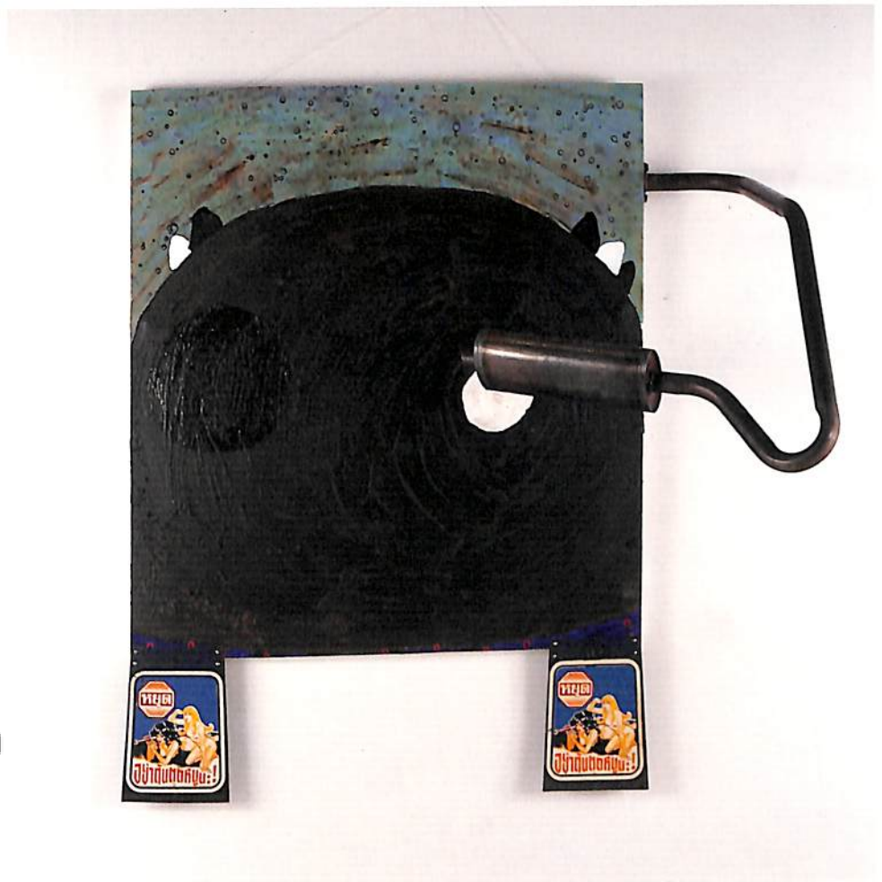
"BROWN AIR, BROWN TREES, BROWN OCEAN AND A DIRTY AUTOMOBILE" 1993 STRETCHER SIZE : 110 x 120 CM ARCYLIC, FISH HOOKS, MUD-GUARD, EXHAUST PIPE, SIDE-VIEW MIRROR ON CANVAS