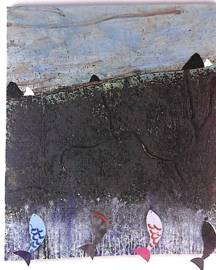
"BROWN AIR, BROWN TREES, BROWN OCEAN" 1993 135 x 155 CM. ARCYLIC, FISH HOOKS, CANVAS FISH ON CANVAS