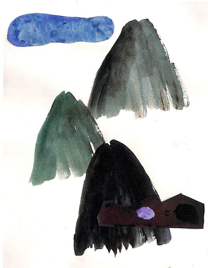
“พิสียา” 1993 25 x 35 CM. ARCYLIC ON PAPER