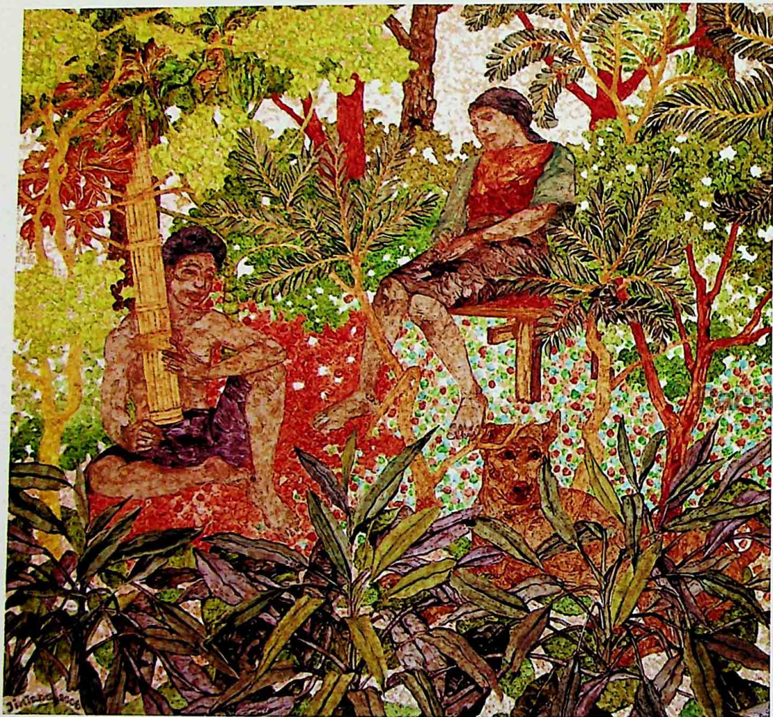
EMPTY SONG ACRYLIC ON CANVAS 50 x 50 CM.