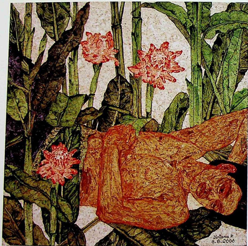
DALA ACRYLIC ON CANVAS 50 x 50 CM.