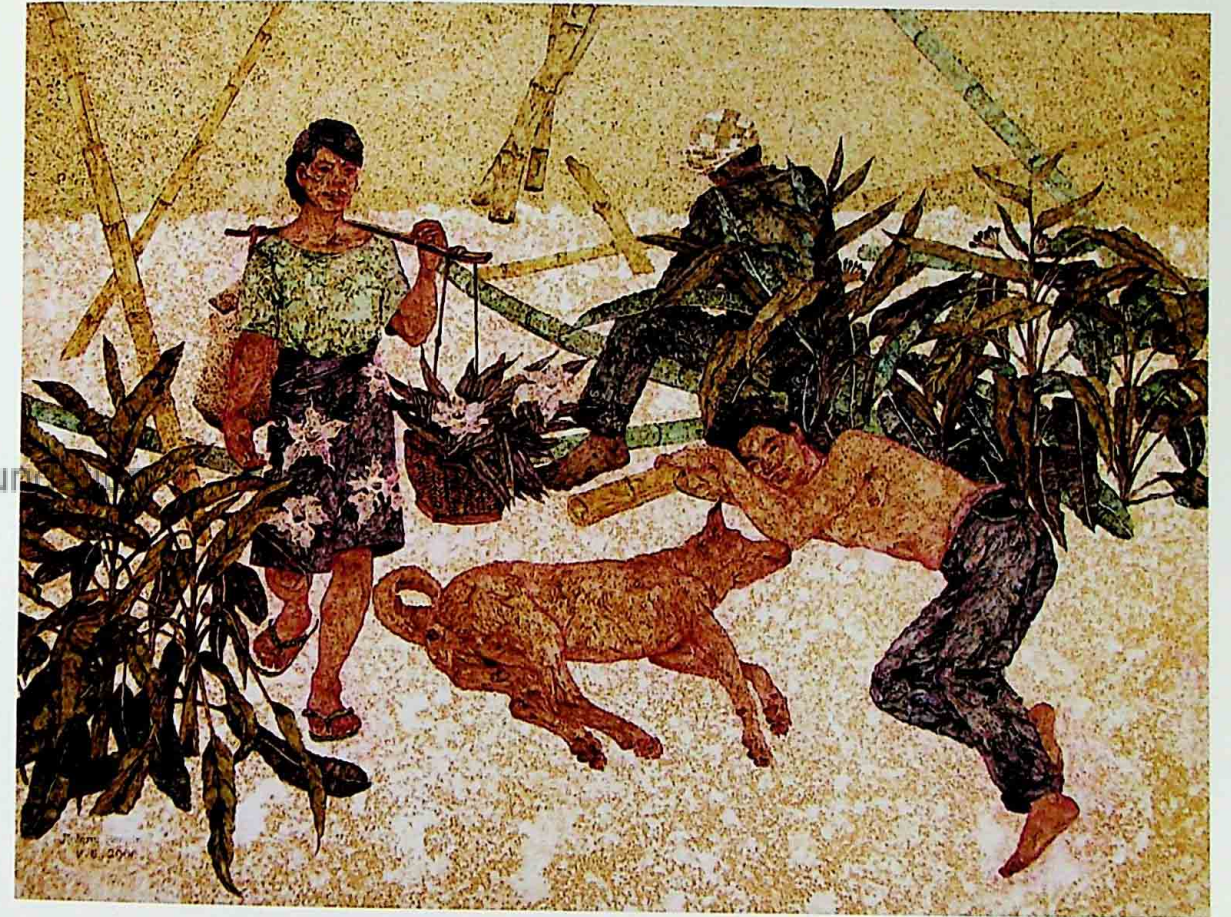
DAYDREAM 1 ACRYLIC ON CANVAS 90 x 120 CM.