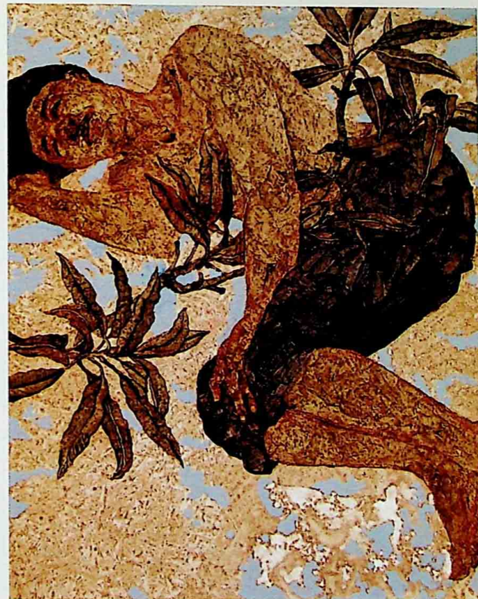
MY LAND 1 ACRYLIC ON CANVAS 30 x 38 CM.