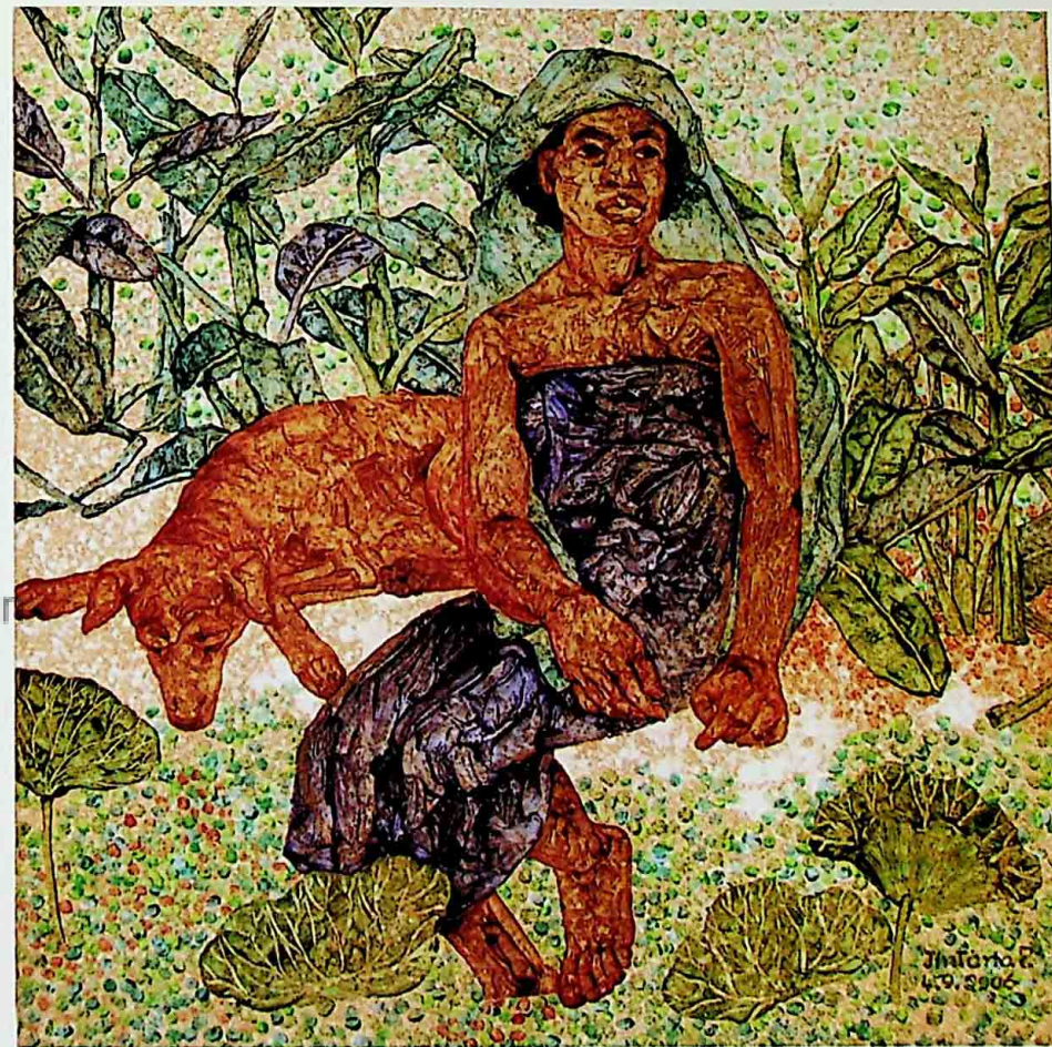
US ACRYLIC ON CANVAS 50 x 50 CM.