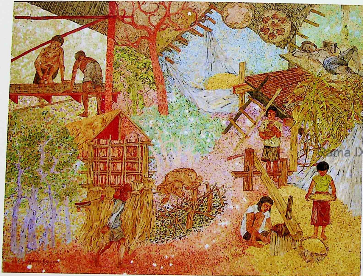
SRISONGKRAM 2 ACRYLIC ON CANVAS 90 x 120 CM.