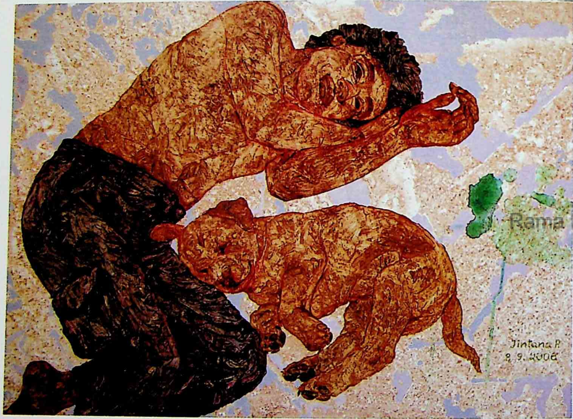
TALKING WITH U ACRYLIC ON CANVAS 50 x 70 CM.