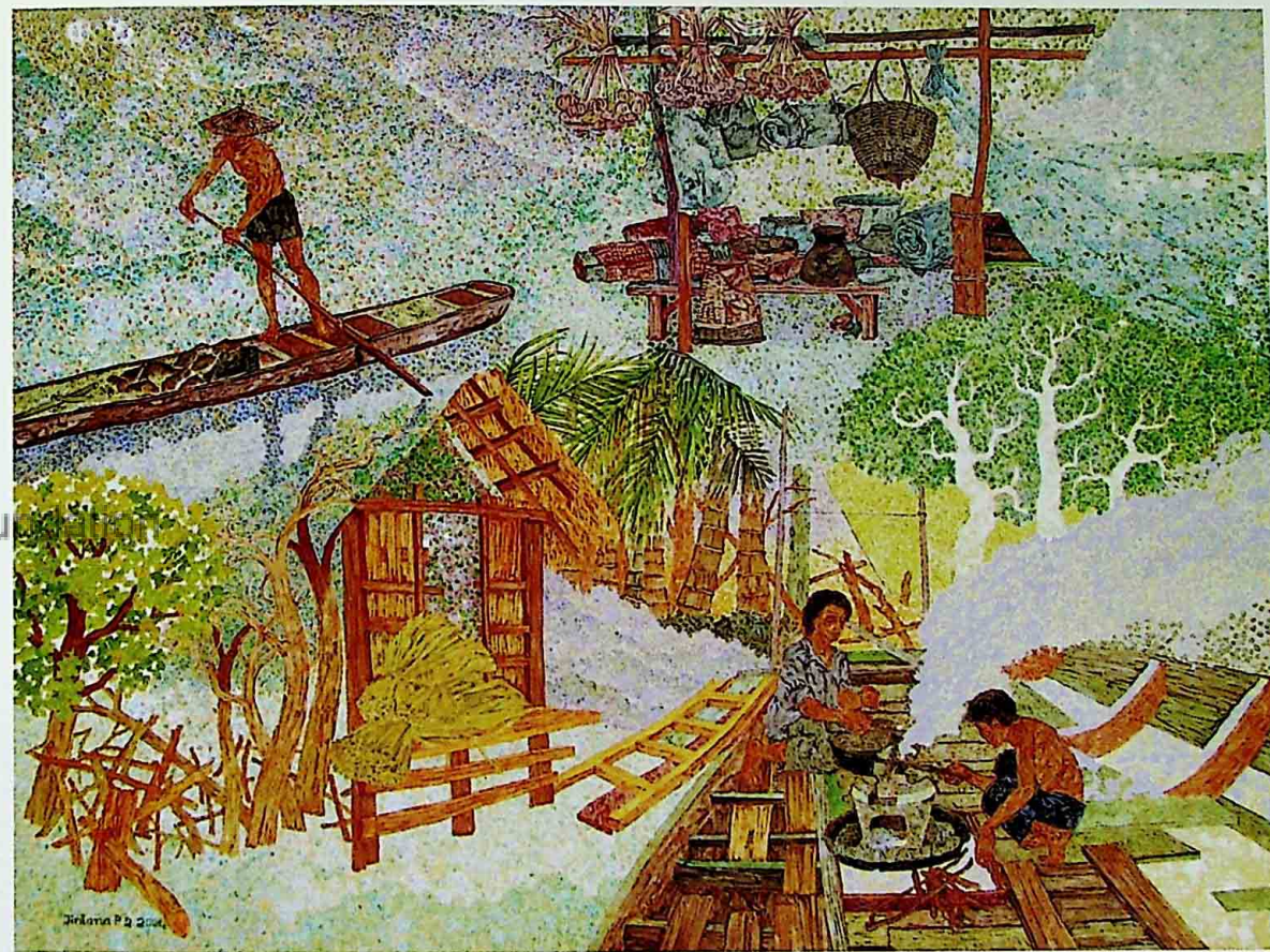
SRISONGKRAM ACRYLIC ON CANVAS 90 x 120 CM.