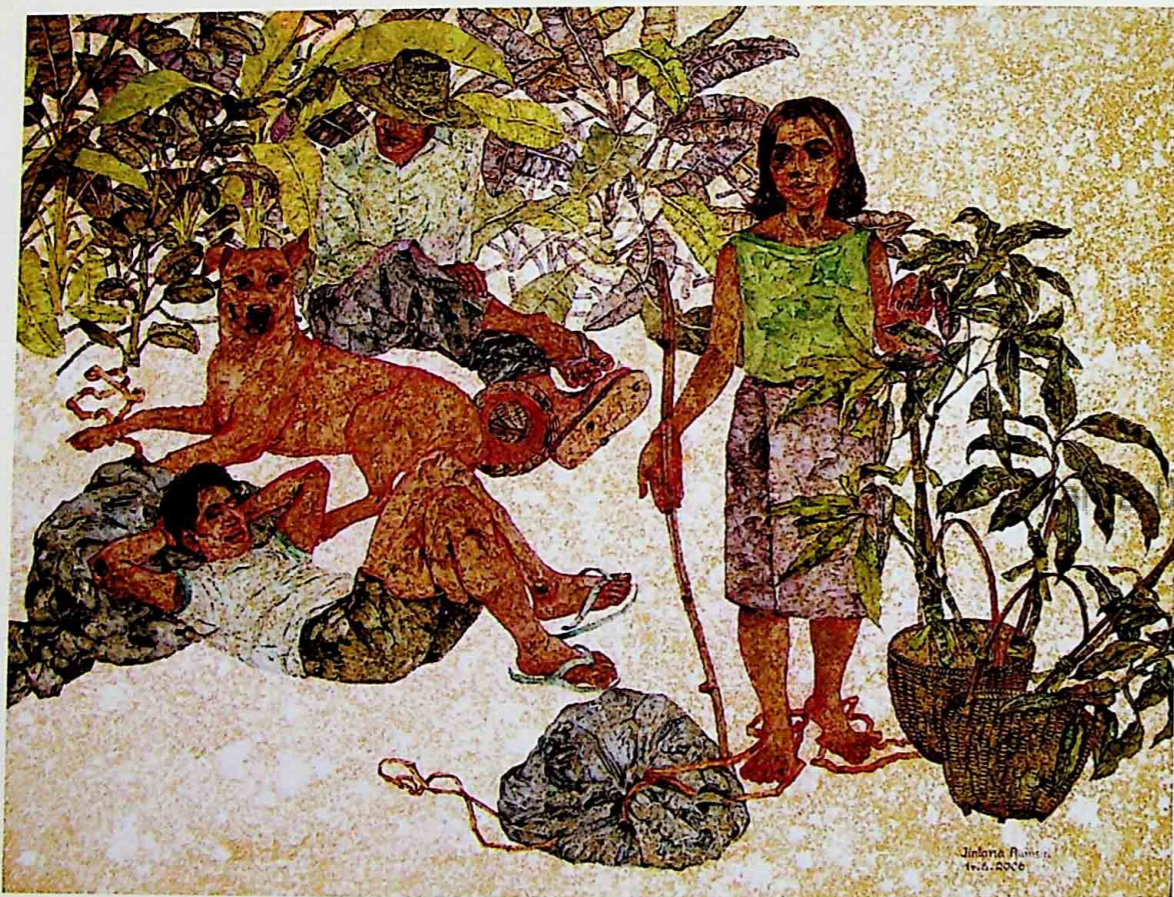
DAYDREAM 2 ACRYLIC ON CANVAS 90 x 120 CM.