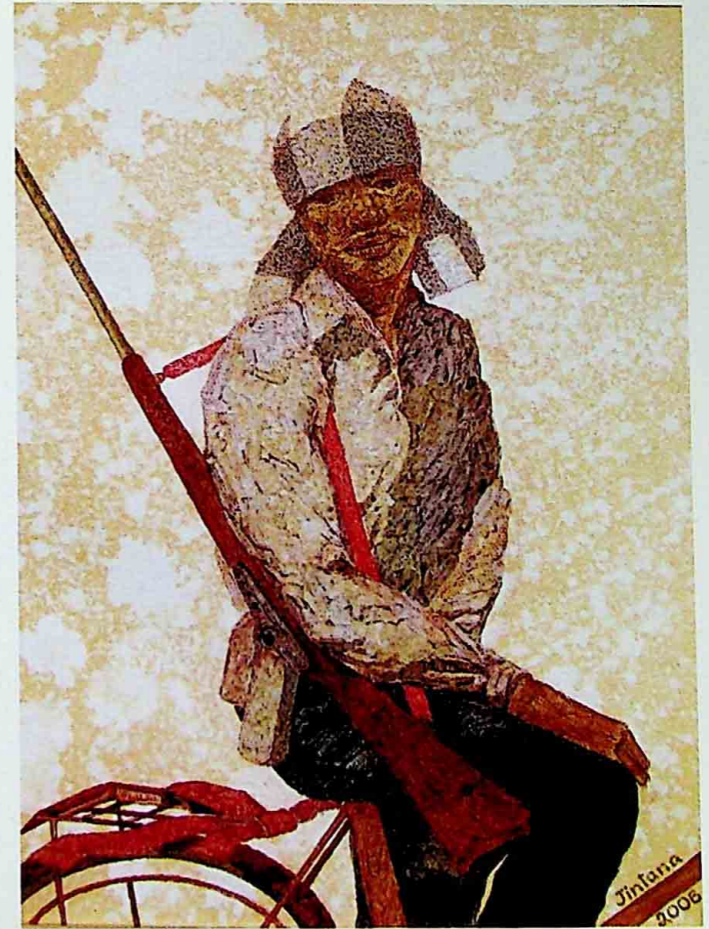
HUNTER OF THE RIVER ACRYLIC ON CANVAS 30 x 40 CM.